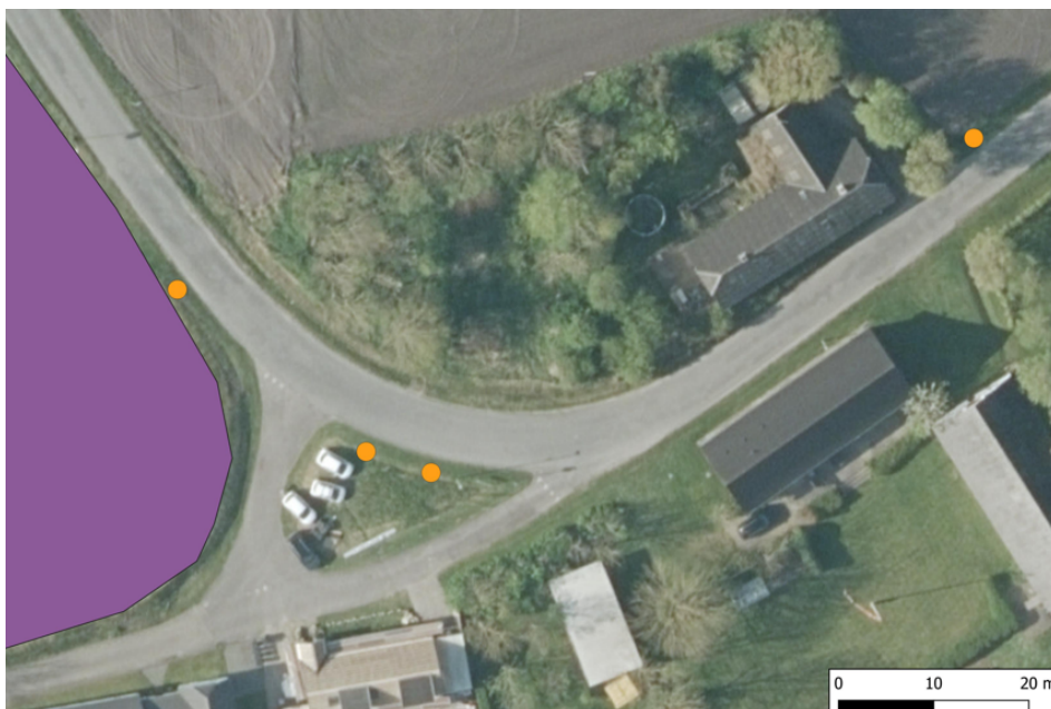
Figur 2 Placering af færdselstavler i relation til det fredede fortidsminde, som er markeret med lilla.

Ansøgning om opsætning af færdselstavlerne er sket i dialog med Slots- og Kulturstyrelsen samt UNESCO Site Manager fra Vesthimmerlands Museum. Slots og Kulturstyrelsen har oplyst, at for så vidt angår 2-meter zonen til det fredede fortidsminde, gælder alene forbud mod dyrkning og detektorbrug, hvorfor projektet kun skal behandles af kommunen efter naturbeskyttelseslovens § 18 og § 65.