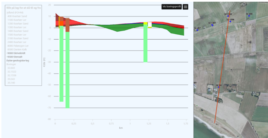
Figur 1 - Tværsnit mod syd

Der er også lavet et tværsnit fra borerne mod nordøst til Mallevej