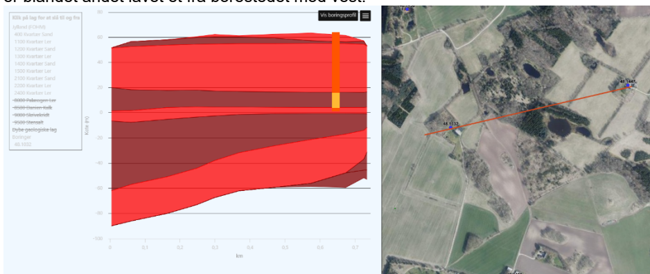
Figur 2 - Tværsnit mod vest

For at få en ide om geologien i området er der lavet flere tværsnit i FOHM-modellen, der er blandet andet lavet et fra borestedet mod vest.