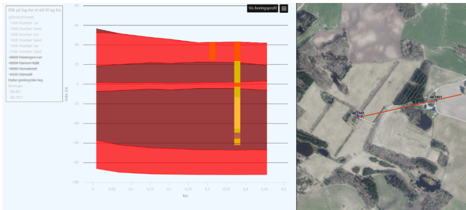
Figur 3 - Tværsnit mod øst

Der ses de samme lerlag som af den virtuelle boring, hvor den nye boring forventes at blive filtersat lige under det andet lerlag, det andet lerlag er genfundet i flere af borerapporterne for boringerne i området og det forventes derfor at være gennemgående. Det vurderes derfor at der ikke vil være hydraulisk kontakt mellem indvindingsmagasinet og vandløb og våde naturtyper.