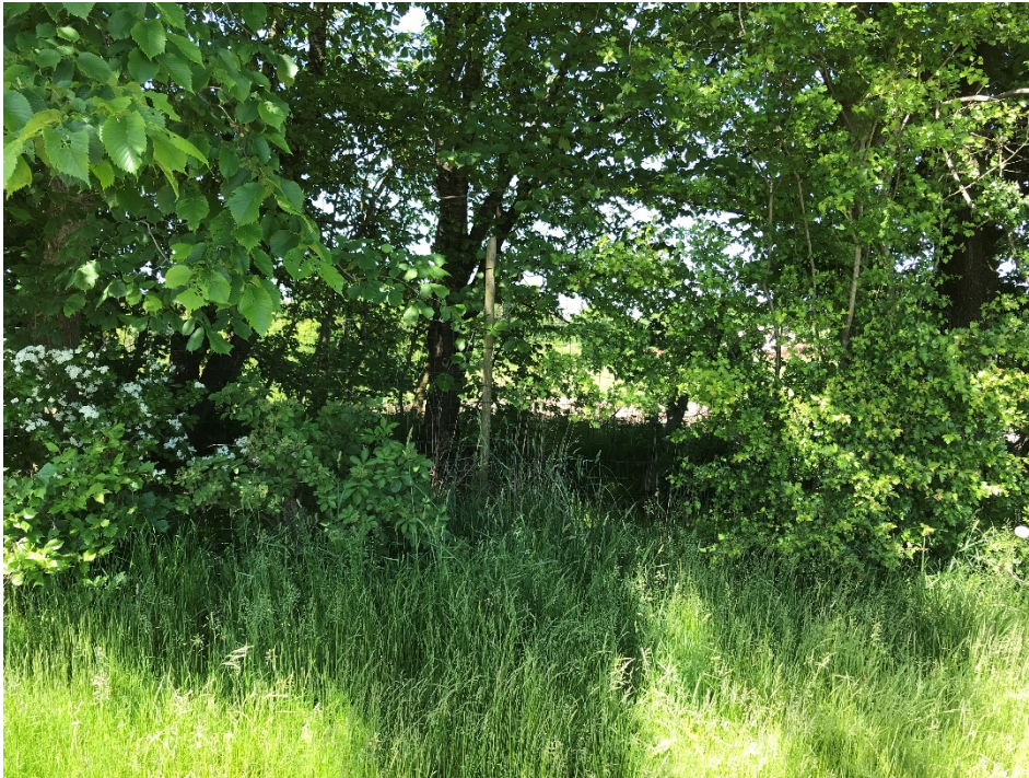
Figur 2 Foto af hegn og skov. En hegnspæl ses i midten af billedet. De fleste af de øvrige hegnspæle er helt skjult af blade på nuværende tidspunkt.