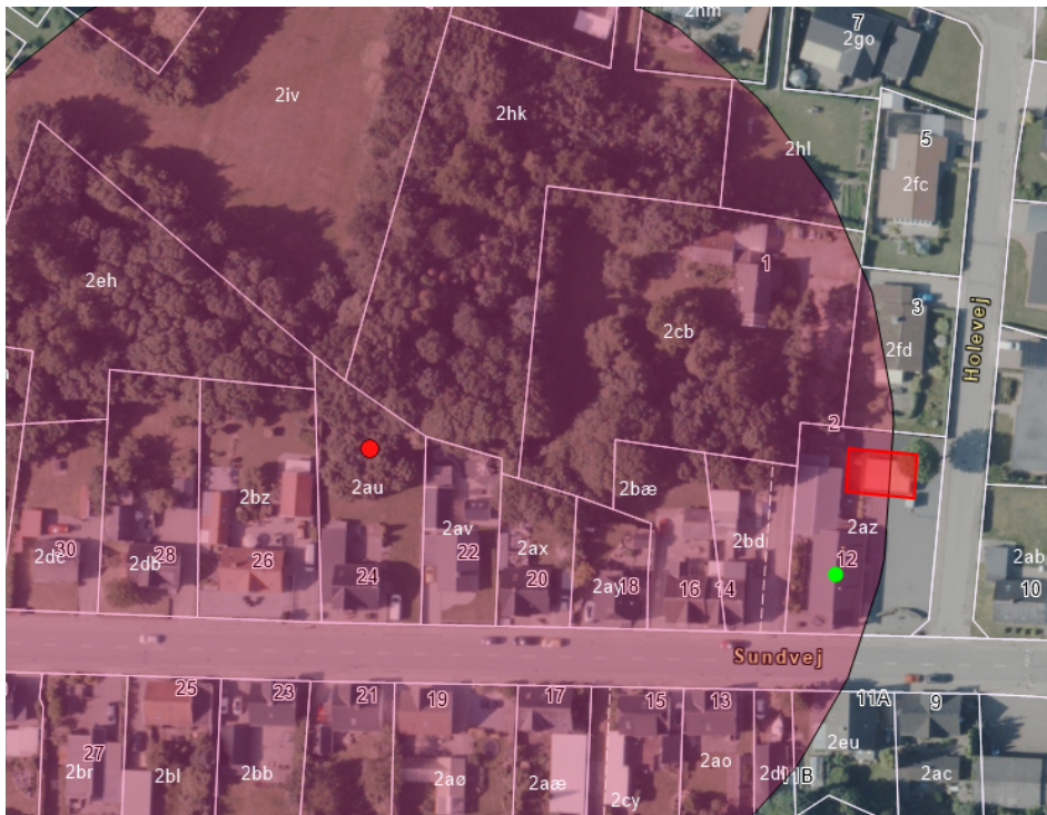
Figur 1 Placering af tilbygning i forhold til gravhøjen der er vist med rød prik. Det ses at bygningen (rød firkant) overlapper med gravhøjens 100-meters beskyttelseszone. Kortet er ikke målfast.

Byggeriet består af en tilbygning til eksisterende erhvervsbygning, der i dag er en genbrugsbutik. Bygningen opføres i én etage med fladt tag (figur 2). Den nye bygning er til udstilling af møbler.