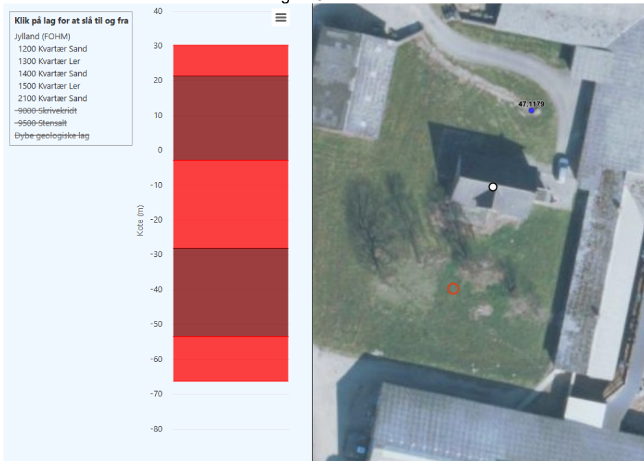
Figur 1 - Virtuel boring

Det forventes at den ny boring laves 50 m dyb, og for at få en ide om geologien på borestedet er der lavet en virtuel boring i FOHM.