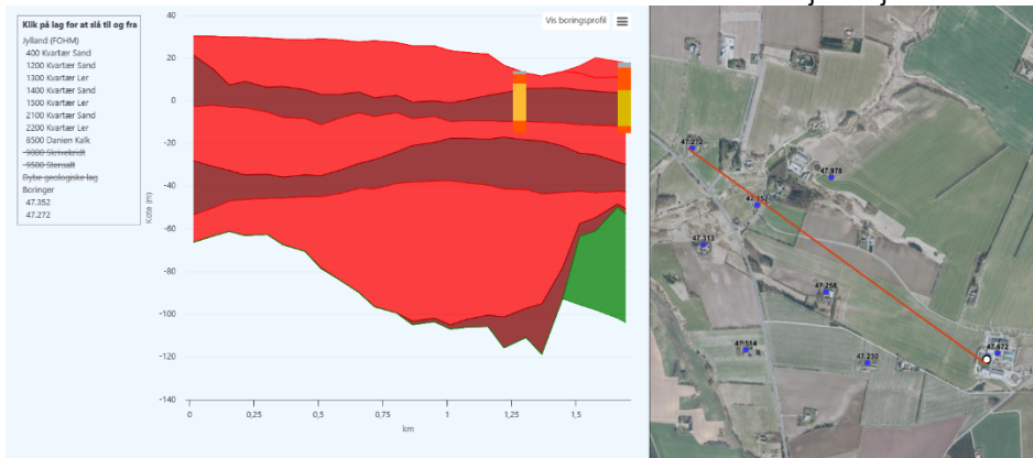
Figur 2 - Tværsnit mod nordvest

For at få en ide om geologien i området er der lavet flere tværsnit i FOHM-modellen, der er blandet andet lavet et tværsnit fra borestedet mod nordvest til Fjordvej.