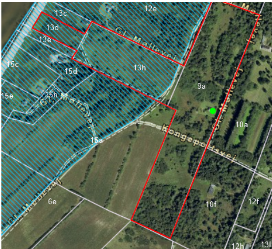
Figur 3: Fredningen Ertebølle Strand (blå)

Arealet er omfattet af fredningen Ertebølle strand. Arealfredningen har fredningsbestemmelser, hvori der ikke må plantes træer og buske, og der må ikke foretages ændringer i det naturlige terræn. Der må ikke foretages udgravning, afgravning eller andre terrænændringer og ej heller etableres trapper på kystskrænten. Der må ikke opstilles master, boder, skure, skilte og lignende.