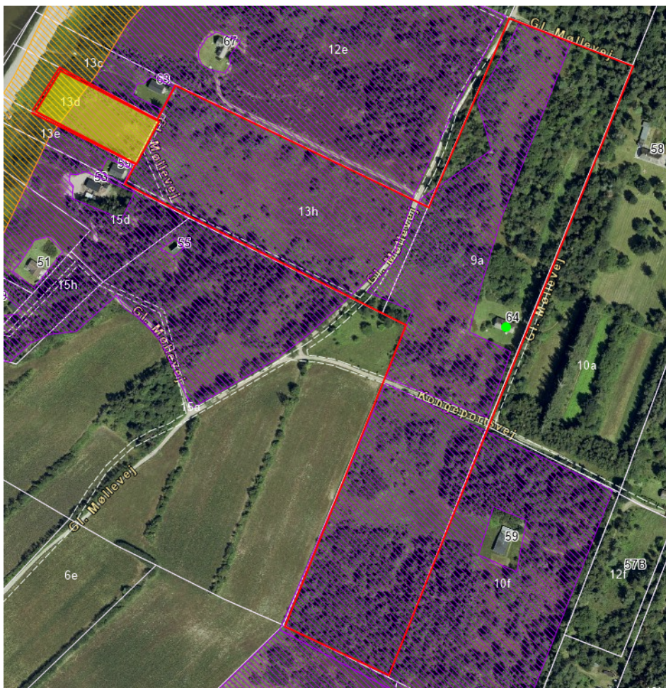
Figur 1: Oversigtskort over projektet. Projektgrænsen fremstår med rødt, areal uden maskineri fremstår med gult. Det beskyttede hedeareal fremstår med lilla skravering.