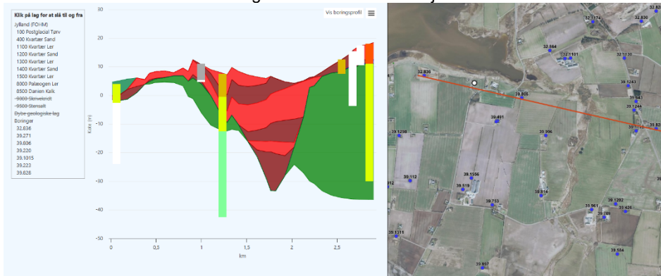
Figur 1 - Tværsnit mod øst

For at få en ide om geologien i området, er der lavet flere tværsnit i FOHM-modellen, der er blandet andet lavet et fra boringen mod øst til Hobrovej.